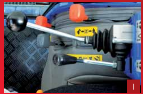
Die Joystick-Kommandozentrale zur kompletten Hydrauliksteuerung.